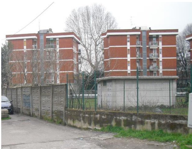
Cabina elettrica in cessione

Nella cessione è compresa anche la cabina elettrica esistente con il relativo sedime.