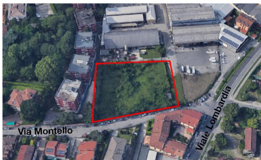
Individuazione area di intervento

L'ambito di intervento è posto nella frazione di San Damiano, in via Montello, nelle vicinanze di viale Lombardia. Si tratta di una superficie libera con la sola eccezione della presenza di una cabina elettrica. L'intorno è caratterizzato dalla presenza di edilizia residenziale e laboratori artigianali.