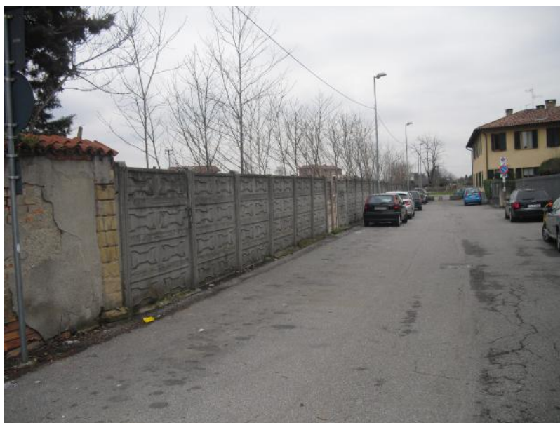
Individuazione area esterna destinata nel P.G.T. a viabilità esistente

In aggiunta è prevista una cessione esterna all'ambito riguardante una parte di un'area ricompresa tra il sedime stradale della via Montello prospiciente il terreno in oggetto, risultante a suo tempo occupata dall'opera pubblica viaria senza formalizzazioni.