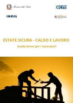
13 - Caldo e lavoro