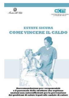
12 – Assistenza nelle strutture