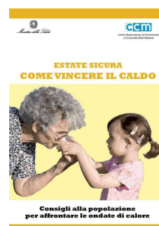
6 - Consigli alla popolazione per affrontare le ondate di calore