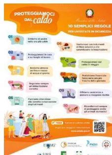
2 – 10 Regole