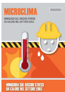
10 - Rischio Stress da calore nel settore edile