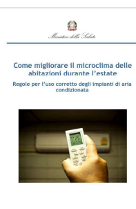
5 - Come migliorare il microclima nelle abitazioni durante l'estate