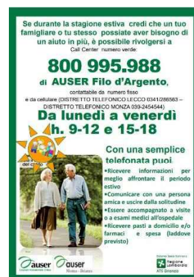
15 - AUSER