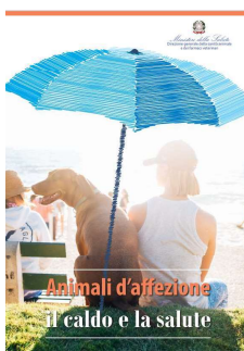
7 - Animali di affezione