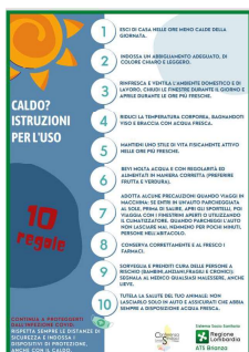
1 - Caldo? Istruzioni per l'uso

Sul sito del Ministero della salute, sono inoltre riportati opuscoli sia di carattere generale (consigli per proteggersi dal caldo), sia di carattere specifico (es. cura degli animali di affezione, viaggiare sicuri ecc.). Gli opuscoli, che saranno messi a disposizione sulla pagina informativa del sito di ATS Brianza, sono: