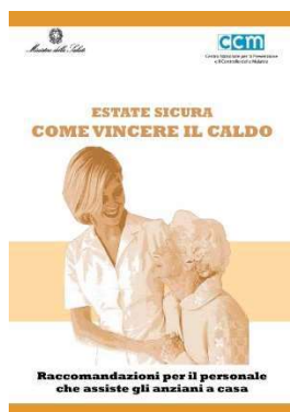
14 - Assistenza a Casa materiale disponibile in diverse lingue (ITA, ENG, RO, FR, PO, RUS)