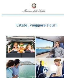
11 – Viaggiare sicuri