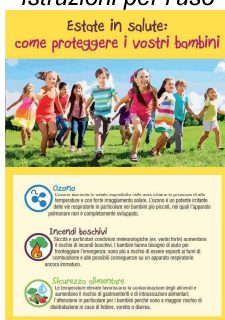
4 - Come proteggere i vostri bambini