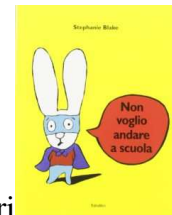
”Non voglio andare a scuola” di S. Blake ed. Babalibri