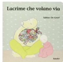
“Lacrime che volano via” di S. De Greef ed. Babalibri