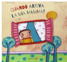
“Quando arriva la mia mamma?” di Paglia-Gobbo ed. Arka