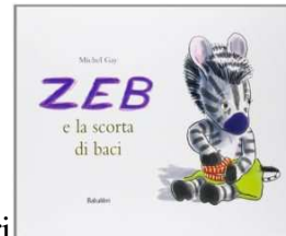
”Zeb e la scorta di baci” di Michel Gay ed. Babalibri