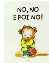
“No, no e poi no!” di Mireille d'Allancé ed. Babalibri