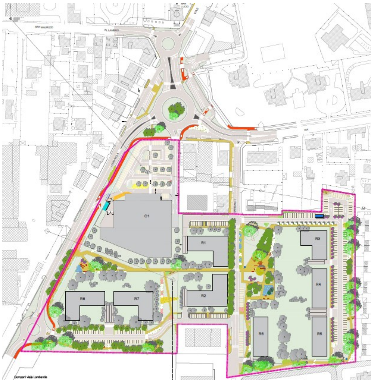
Fig.2 - planivolumetrico proposta di variante PII - ambito viale Lombardia

L'ambito di PII, tra via Garibaldi e viale Lombardia, costituiva un vuoto urbano interstiziale che attraverso l'attuazione va invece ad esprimere una nuova tessera del mosaico di quartiere.