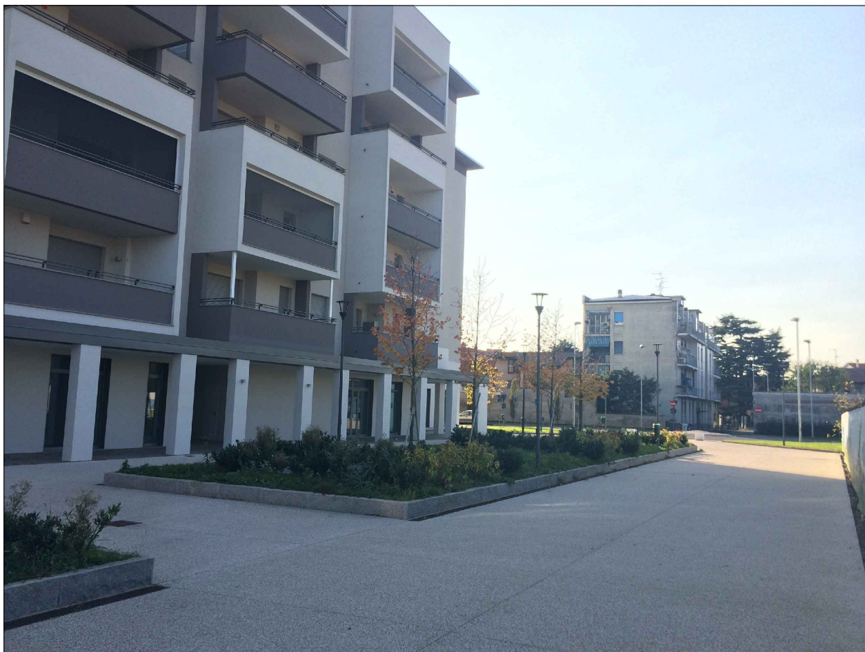
PUNTO DI VISTA N°1