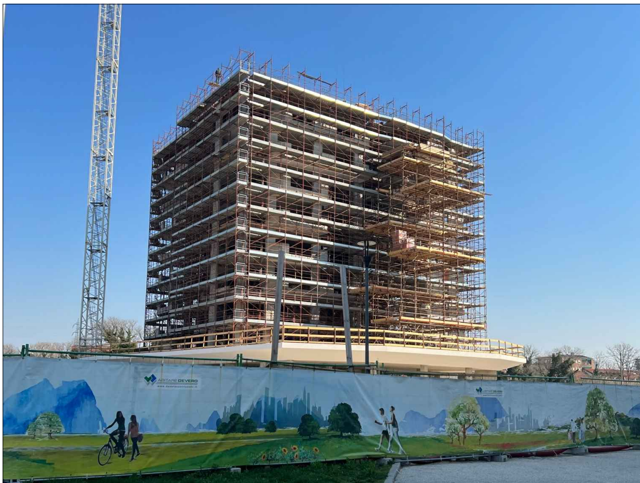
PUNTO DI VISTA N°3