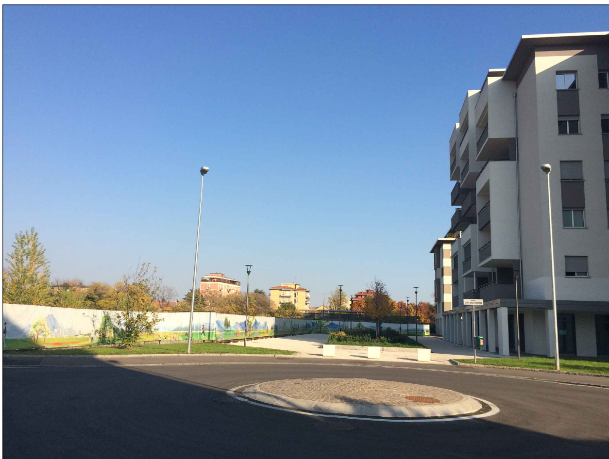
PUNTO DI VISTA N°2