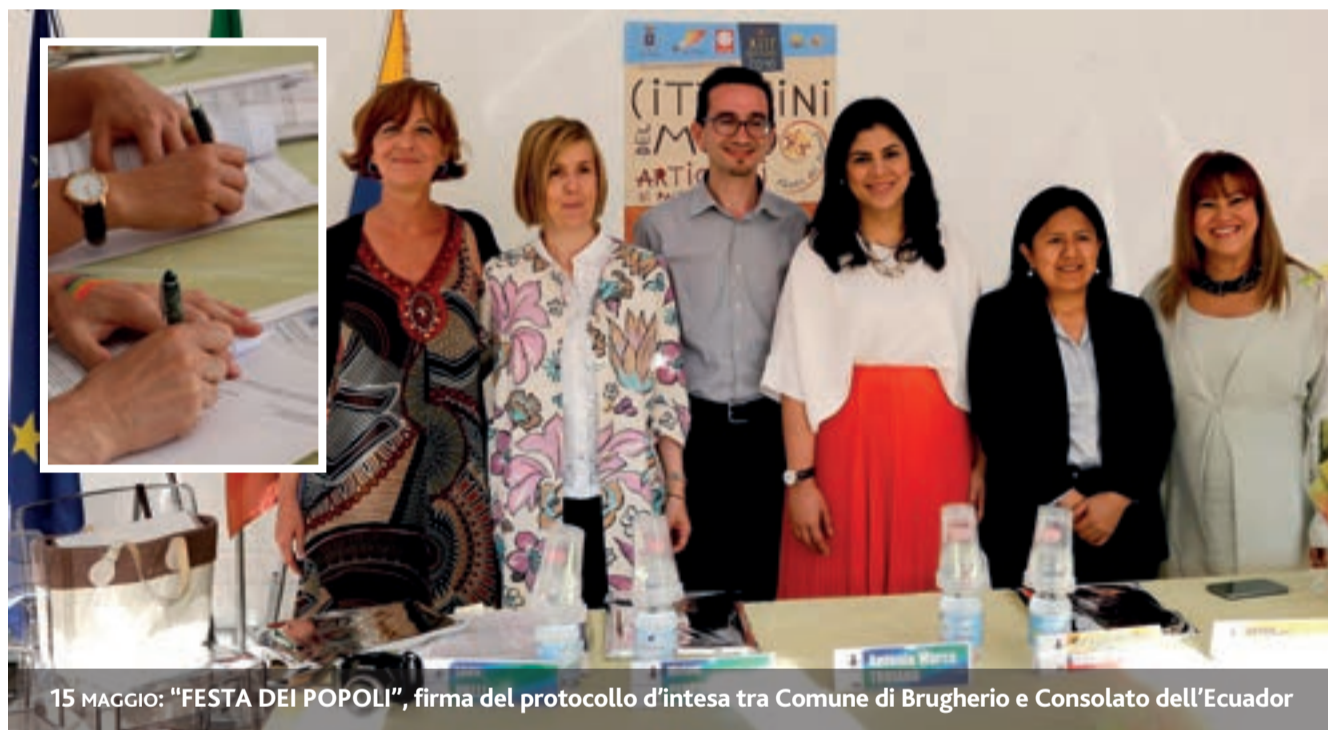
15 MAGGIO: "FESTA DEI POPOLI", firma del protocollo d'intesa tra Comune di Brugherio e Consolato dell'Ecuador