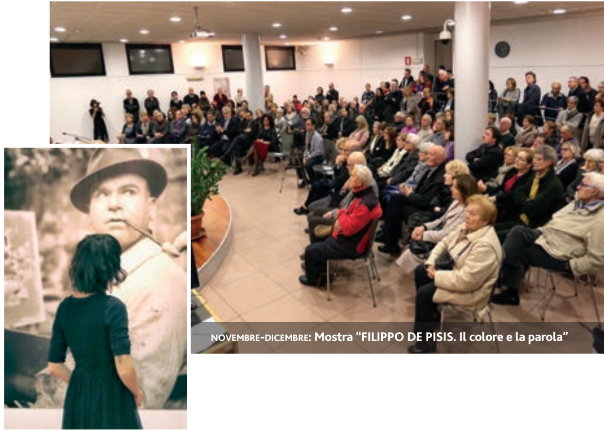
NOVEMBRE-DICEMBRE: Mostra "FILIPPO DE PISIS. Il colore e la parola"