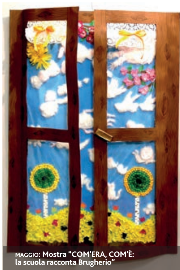
MAGGIO: Mostra "COM'ERA, COM'È: la scuola racconta Brugherio"