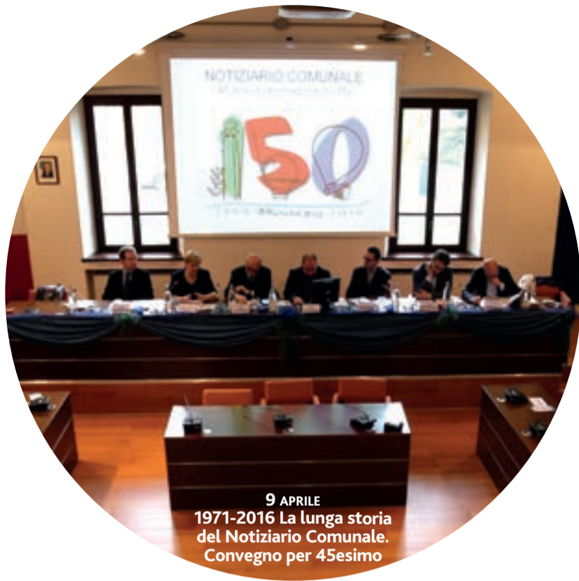
9 APRILE 1971-2016 La lunga storia del Notiziario Comunale. Convegno per 45esimo