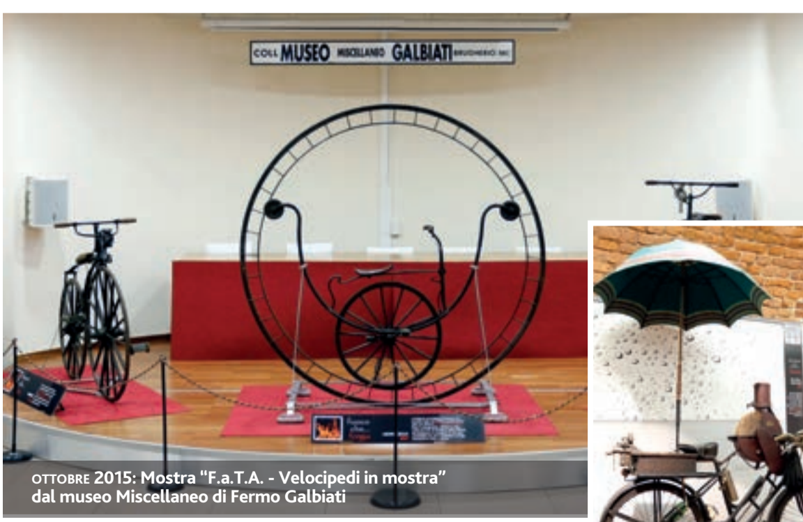
OTTOBRE 2015: Mostra "F.a.T.A. - Velocipedi in mostra" dal museo Miscellaneo di Fermo Galbiati