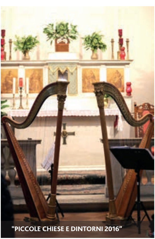
"PICCOLE CHIESE E DINTORNI 2016"