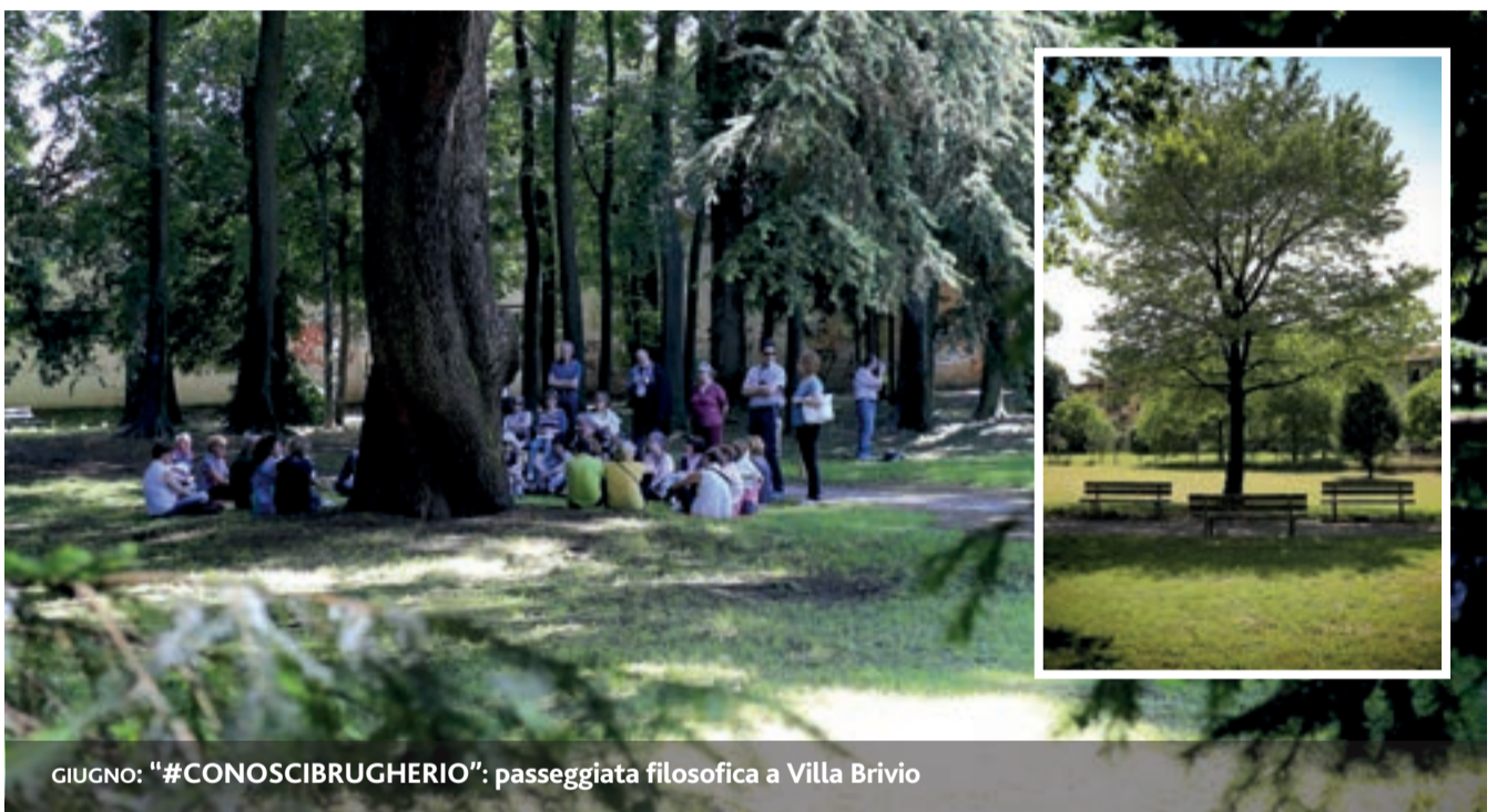
GIUGNO: "#CONOSCIBRUGHERIO": passeggiata filosofica a Villa Brivio