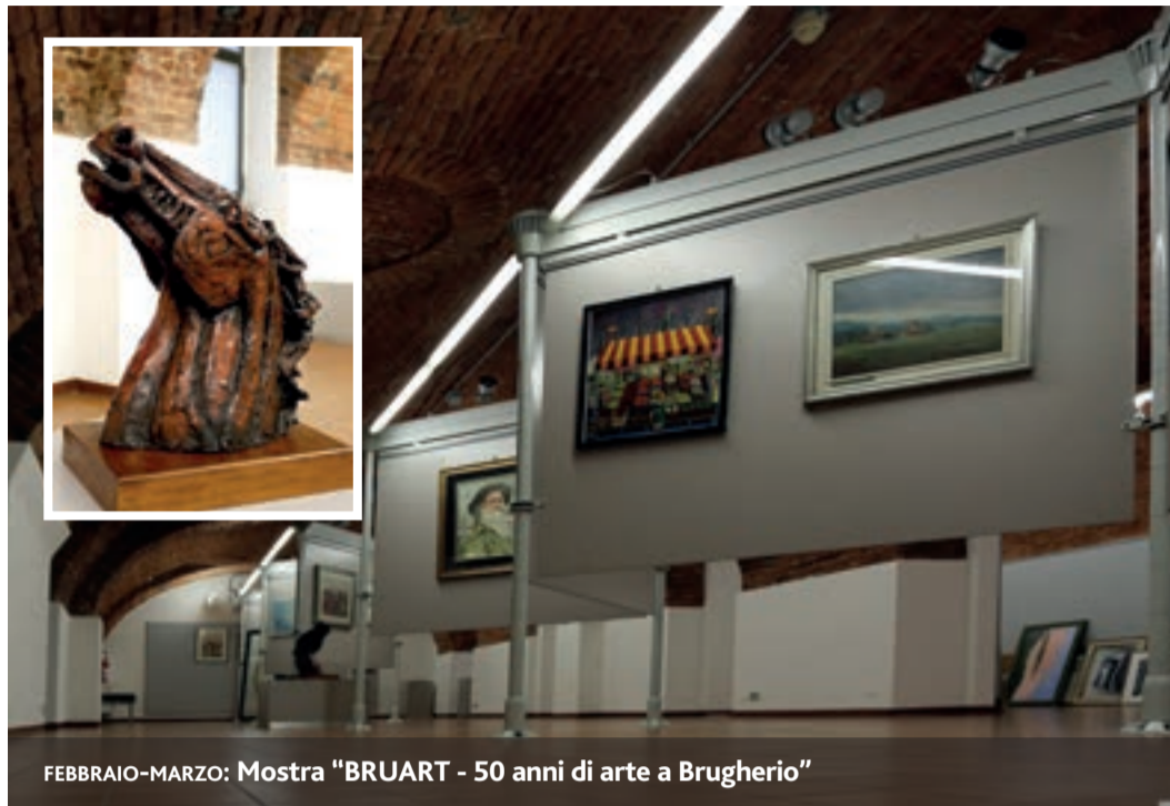
FEBBRAIO-MARZO: Mostra "BRUART - 50 anni di arte a Brugherio"