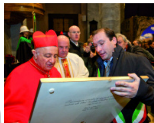
La benedizione di Tettamanzi alla comunità pastorale