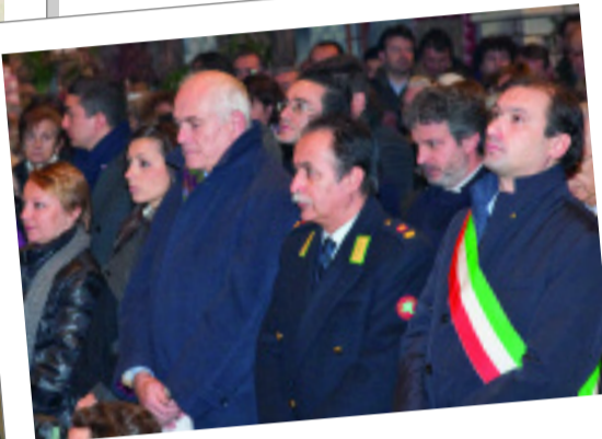
Il Comune ha confermato a S.E. il proprio impegno per valorizzare le sacre reliquie