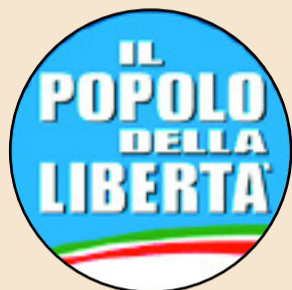
POPOLO DELLA LIBERTÀ