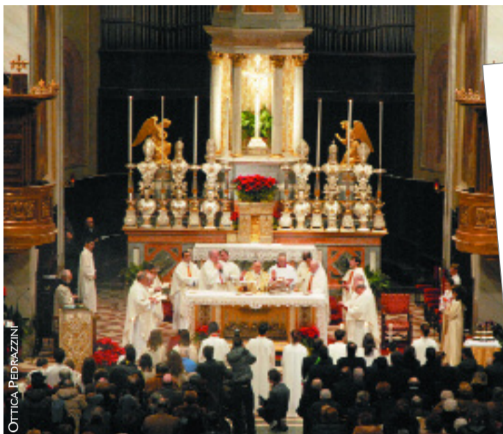
Una folla di fedeli ha accolto con grande partecipazione l'Arcivescovo della Diocesi