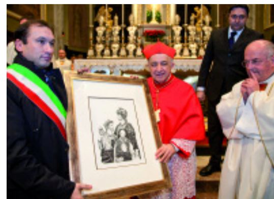
Il Sindaco Maurizio Ronchi dona al Cardinale una litografia di Lucia Sardi a nome della cittadinanza