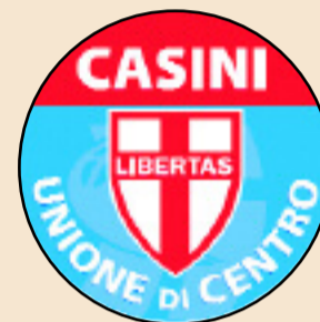
UNIONE DI CENTRO

L'UDC sostiene di fatto la Giunta senza chiedere poltrone: vogliamo il bene comune prima di ogni bene di partito e al "bene comune" io ho sempre dato priorità, mettendo in secondo piano anche le beghe nazionali fra i leaders dei partiti. Qual è oggi il bene comune per Brugherio? Smetterla di litigare decidendo di "fare" e non discutere per anni, perdendo occasioni preziose. Nella nuova Provincia dobbiamo contare, altrimenti finanziamenti e opere vanno altrove. Persona e famiglia al primo posto, quindi burocrati al servizio della gente (cultura del risultato più che della procedura), scelte urbanistiche che realizzino le proposte sul tavolo da anni, (o altre migliori se arrivano), tendenti a portare in città posti di lavoro di media e alta qualificazione in contesto ecocompatibile. Se c'è lavoro le famiglie hanno un futuro sereno. Inoltre queste realizzazioni portano entrate fisse per migliorare i servizi per scuola, cultura, assistenza, ambiente, sicurezza ed entrate straordinarie per opere pubbliche urgenti, cioè sviluppo socio-economico e ambientale per Brugherio. Senza mezzi si può solo parlare ma non fare, e le mosse della Giunta Ronchi mi sembrano positive.