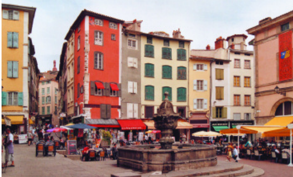
UN PITTORESCO SCORCIO DELLA CITTADINA DI PUY, CHE HA GIÀ OSPITATO UNA DELEGAZIONE BRUGHERESE PER I FESTEGGIAMENTI LO SCORSO AUTUNNO