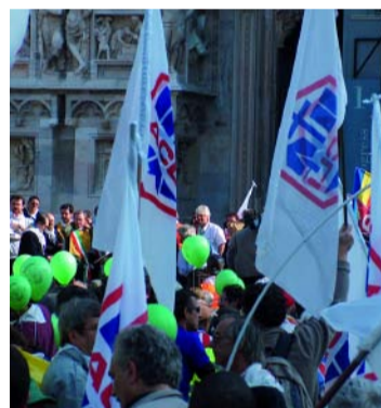
I DISCORSI DELLE AUTORITÀ SUL SAGRATO

pi provenienti da cinque diversi itinerari snodatisi nell'hinterland (varie centinaia di ciclisti al traguardo). Il culmine della manifestazione, tra breve visita ai Rom di via Idro, omaggio "volante" ai martiri di Gorla, e stand up collettivo alle varie tappe, si è raggiunto con gli interventi di Lella Costa e del Cardinale Tettamanzi sul sagrato del Duomo. Nell'ambito delle iniziative indette in questo periodo, c'è da segnalare anche un con-