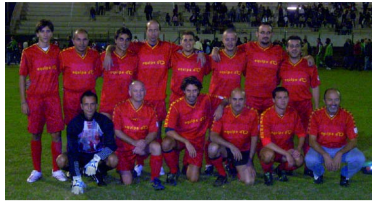
LA RAPPRESENTANZA DEI DIPENDENTI COMUNALI E POLITICI BRUGHERESI

L'iniziativa si è svolta nell'ambito della Festa dello sport