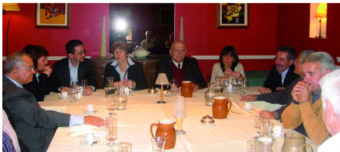
LA DELEGAZIONE ITALIANA ERA COMPOSTA DA 8 PERSONE IN RAPPRESENTANZA DEL COMUNE E 62 MEMBRI DELLE ASSOCIAZIONI LOCALI BRUGHERESI

delegazione ufficiale dell'amministrazione con la quale si è creato un rapporto molto forte e la partenza per il ritorno a casa. Ora tocca a noi, tra marzo e aprile organizzeremo la festa a Brughiero per i venti anni del gemellaggio; sarà una bella occasione per ricambiare l'ospitalità dei vecchi e nuovi amici francesi, e per far progredire, passo dopo passo, questo gemellaggio tra le nostre due città.