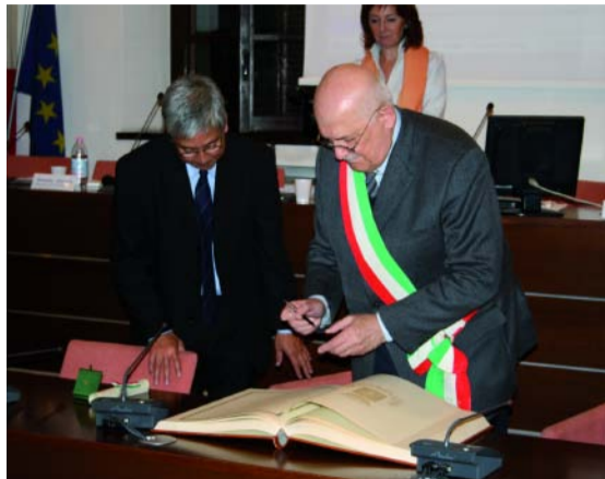
IL DOTTOR ZAWMIN E IL SINDACO FIRMANO IL LIBRO D'ONORE DEL COMUNE DI BRUGHERIO

che si è detta molto impressionata dalle ultime parole del monaco. Questi, prima di essere tratto in arresto, lo scorso mese di novembre aveva infatti dichiarato: "Chiedo con tutto il cuore alla co-