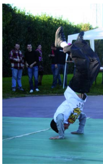
UN'ESIBIZIONE DI BREAK DANCE

Una volta era in voga il ballo delle debuttanti. In questi tempi più moderni, si dà il caso che la tradizione di celebrare il debutto in società delle giovani adolescenti di famiglia benestante sia andata ormai perduta. Eppure, proprio a Brughiero, le giovani debuttanti sembrerebbero aver ceduto spazio a chi, a prescindere dal ceto sociale e dall'identità sessuale, si avvicina semplicemente alle diciotto candeline. Sabato 4 ottobre, infatti, nell'ambito dell'Area Feste di via Aldo Moro, si è svolta la seconda edizione della Festa dei Diciottenni organizzata dall'Assessorato ai Giovani del Comune di Brughiero.