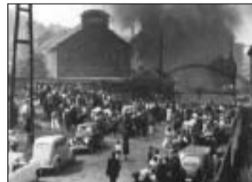
Foto d'epoca e immagini della commemorazione dei minatori morti, svoltasi a Marcinelle lo scorso 8 agosto