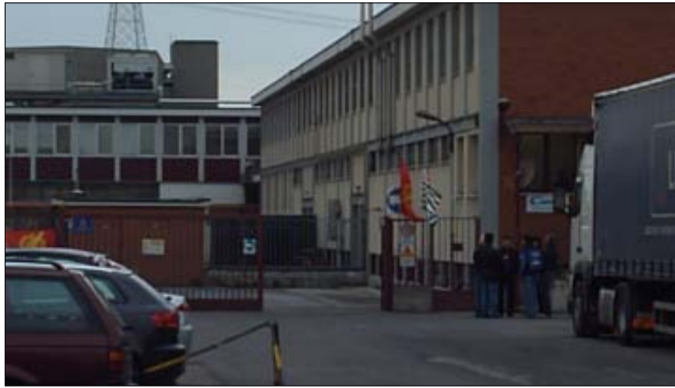
A sinistra l'ingresso della ditta Candy sulla strada tra Brugherio e Monza